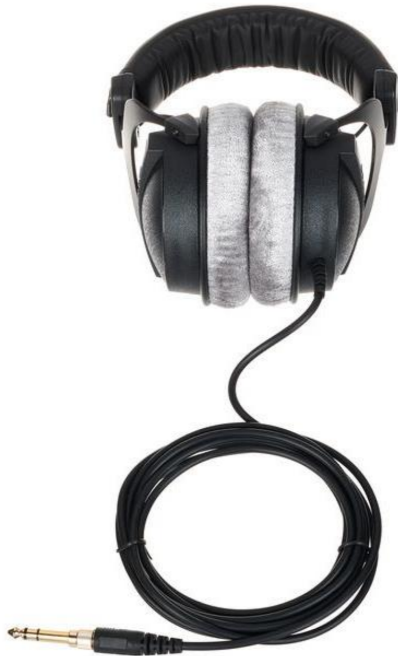
Beyerdynamic DT 770 Pro 80